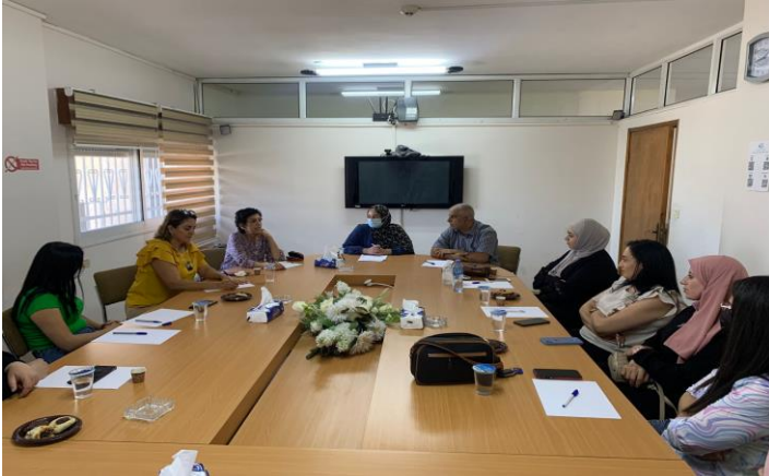
إعادة تشكيل و تفعيل لجنة صاحبات الأعمال

يعتبر مركز صاحبات الأعمال أول مركز نسائي مستقل على مستوى الغرف في فلسطين، حيث يقدم لصاحبات الأعمال الخدمات المميزة، و تم خلال العام 2022 إعادة تشكيل و تفعيل لجنة صاحبات الأعمال و تحقيق العديد من الانجازات و منها تنظيم المحاضرات و ورشات العمل التي تهتم سيدات و صاحبات الأعمال، و تنظيم برامج تدريبية و المشاركة في عدد من المعارض المحلية.