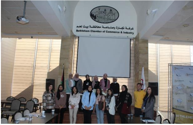
جامعة القدس - برنامج الدراسات الثنائية