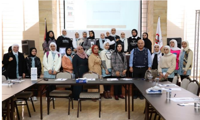
مدرسة بنات نحالين الثانوية