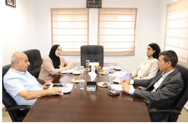
استقبال المستشار التجاري للسفارة النمساوية