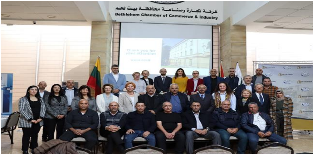
تنظيم لقاءات عمل ثنائية بين رجال أعمال من محافظة بيت لحم مع نظرائهم من جمهورية ليتوانيا.