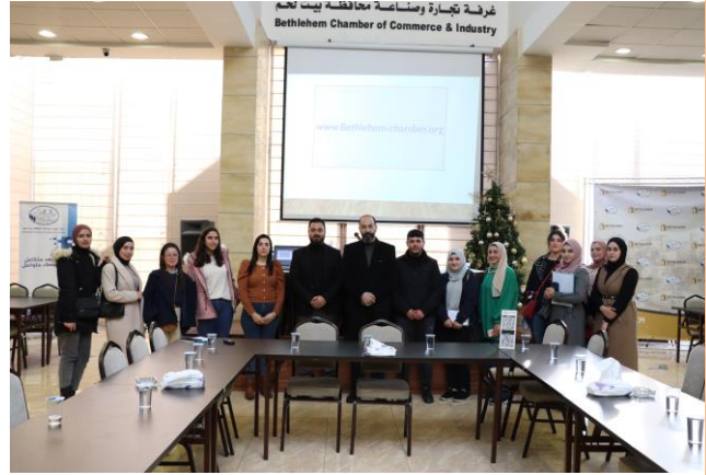
جامعة فلسطين الأهلية