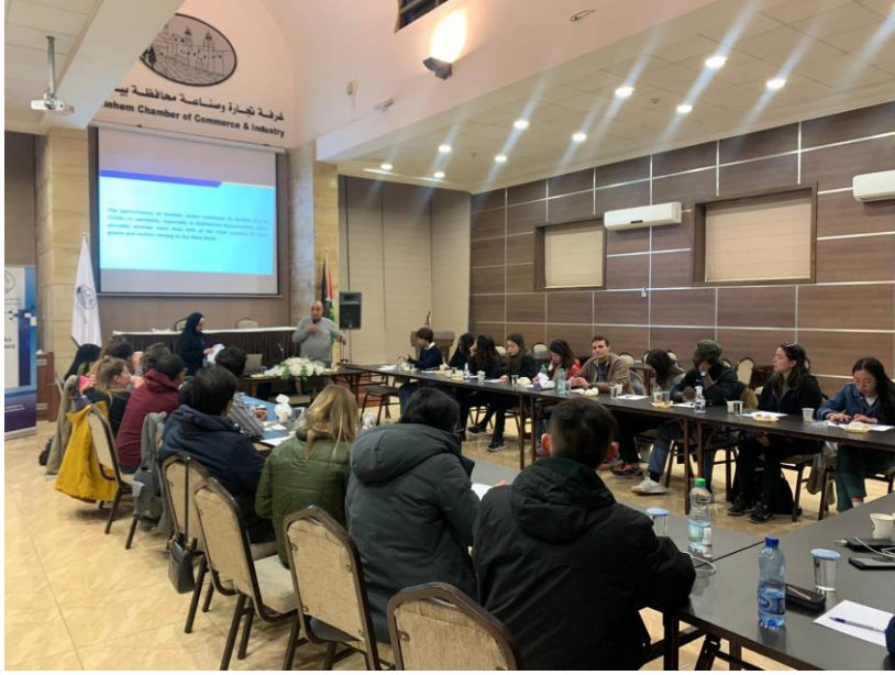
جامعة شيكاغو الأمريكية

تحرص غرفة تجارة و صناعة محافظة بيت لحم على تعزيز التواصل مع المجتمع المحلي و القطاع الأكاديمي محليا و دوليا لنشر التوعية و التعريف بدورها و الخدمات التي تقدمها لمجتمع الأعمال في المحافظة، و استضافت غرفة بيت لحم خلال العام 2022 عدة مجموعات طلابية من المدارس و الجامعات الوطنية و الدولية.