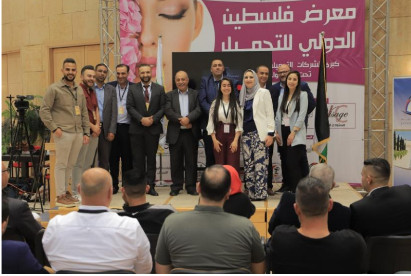
تكريم المشاركين في معرض فلسطين الدولي للتجميل

في اختتام فعاليات معرض فلسطين الدولي الاول للتجميل الذي تنظمه نقابة اصحاب شركات ومصانع ومستودعات التجميل في فلسطين بالتعاون مع غرفة تجارة وصناعة بيت لحم وبرعاية وزارتي الاقتصاد والصحة الفلسطينيتين، قامت الغرفة بتكريم مجموعة المصانع والشركات والمستودعات المشاركة في المعرض.