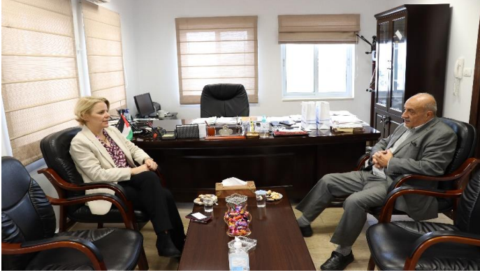
استقبال سفيرة سويسرا لدى دولة فلسطين

تولي غرفة تجارة و صناعة محافظة بيت لحم اهتماما كبيرا بتطوير العلاقات الاقتصادية مع الدول العربية و الأجنبية من خلال فتح مجالات التعاون التجاري و عقد لقاءات عمل ثنائية بين رجال الأعمال الفلسطينيين و نظرائهم من الدول الصديقة، كذلك تهتم غرفة بيت لحم بنقل الخبرات الخارجية الى المنشآت المحلية لتطوير مجالات عملهم و خصوصا في مجالات تكنولوجيا المعلومات كذلك التعاون في بناء قدرات و تطوير مهارات صاحبات الأعمال و اسناد الرياديات.