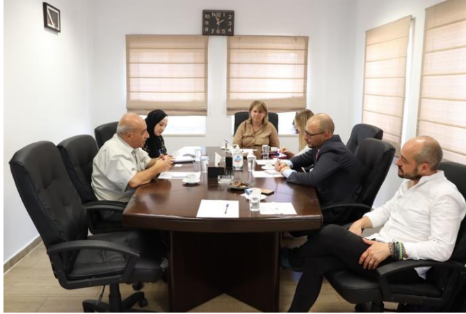
استقبال مُمثل جمهورية لتوانيا