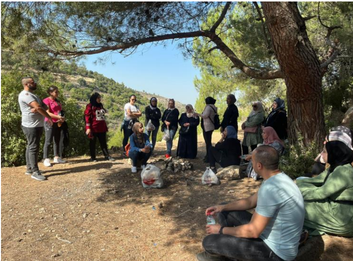
تنظيم مسار بمناسبة شهر أكتوبر الوردي

تنظيم دورات تدريبية لمجموعة من مُستفيدات مركز صاحبات الأعمال بالتعاون مع دائرة العمل النسوي في مديرية أوقاف بيت لحم حيث تم تخريج 53 سيدة في دورتي تزيين المناسبات وتصميم توزيعات المناسبات.