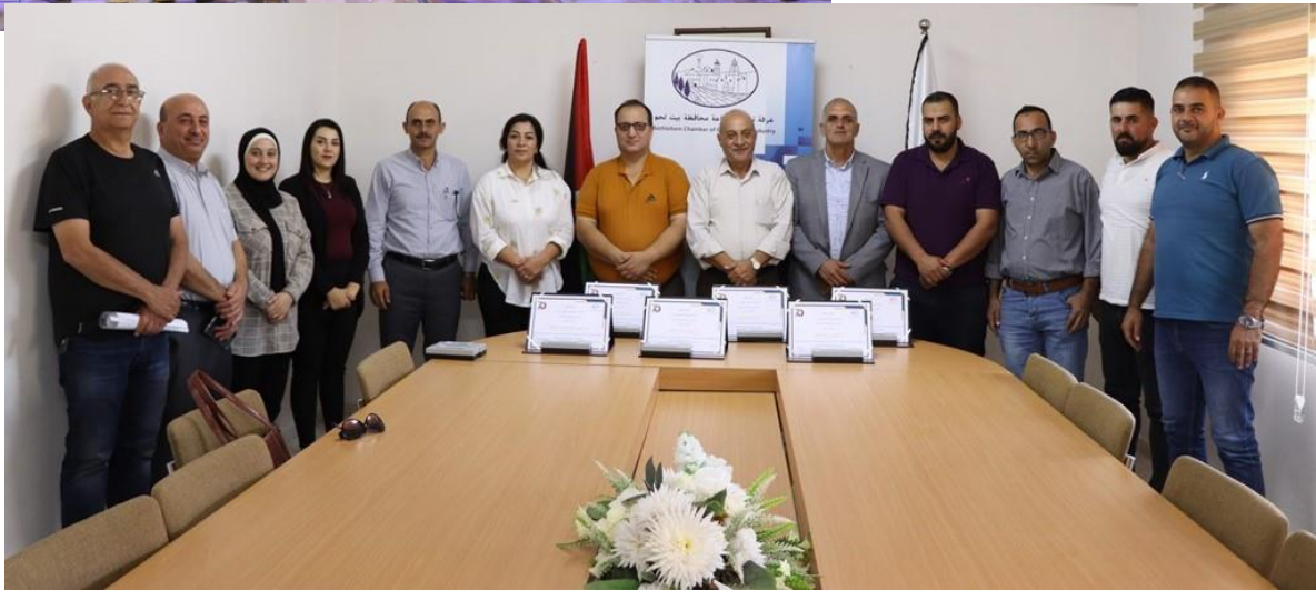
تكريم شركاء غرفة بيت لحم في تنظيم الأيام التسويقية للعبب والمُنتجات النسوية الرابع

تكريم المشاركين في معرض فلسطين الغذائي في اختتام فعاليات معرض فلسطين الغذائي الذي نظّمته نقابة أصحاب شركات ومحلات تجارة المواد الغذائية - محافظة الخليل وبرعاية وزارة الاقتصاد الفلسطينية، قامت الغرفة التجارية الصناعية في محافظة بيت لحم بتكريم مجموعة الشركات والتجار المشاركة في المعرض.