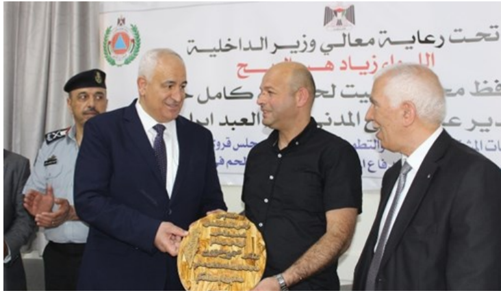
افتتاح مقر الدفاع المدني في الريف الغربي لمحافظة بيت لحم