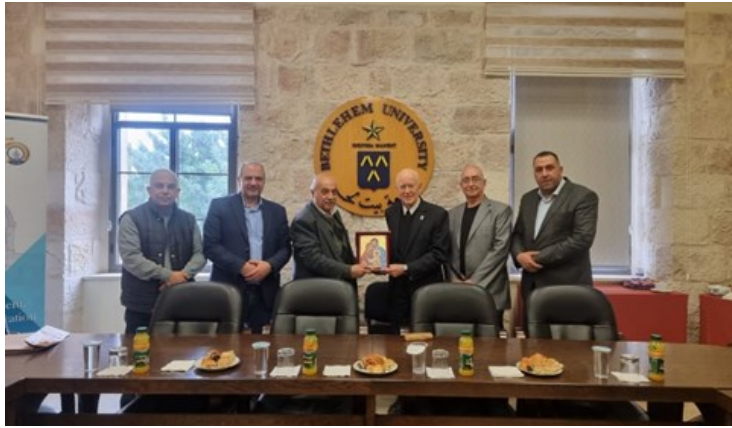
تكريم نائب الرئيس الأعلى لجامعة بيت لحم