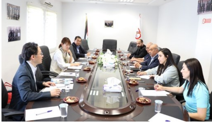
استقبال وفد من الوكالة اليابانية للتعاون الدولي - جايا