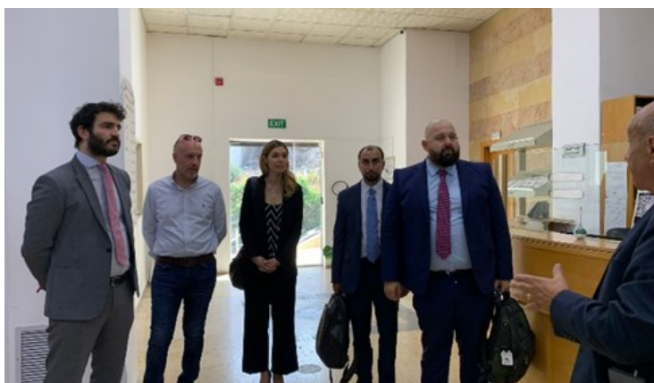
استقبال وفد من القنصلية الإيطالية