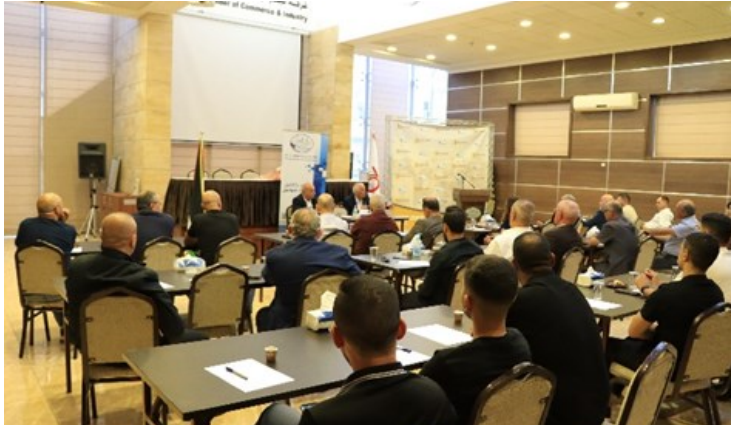
تنظيم لقاء حوارى حول الأوضاع الاقتصادية الاجتماعية خلال العدوان على غزة

وبمبادرة من غرفة تجارة وصناعة مُحافظة بيت لحم تم تشكيل لجنة طوارئ اقتصادية تضم كافة جهات الاختصاص من مؤسسات القطاع العام والقطاع الخاص ذات العلاقة لفحص مخزون المواد التموينية والسلع الغذائية الأساسية وضمان سهولة حركة الشاحنات لإدخال البضائع والمحروقات لتوفير احتياجات المواطنين وكذلك مراقبة الأسعار، وقد عملت اللجنة على متابعة الوضع الاقتصادي العام في المُحافظة.