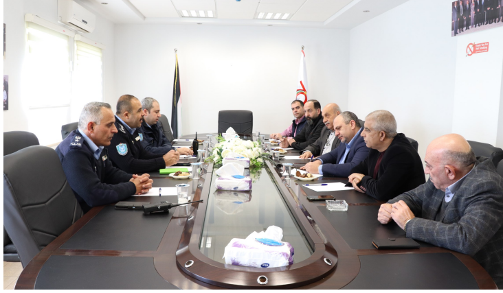
مُديرية شرطة بيت لحم