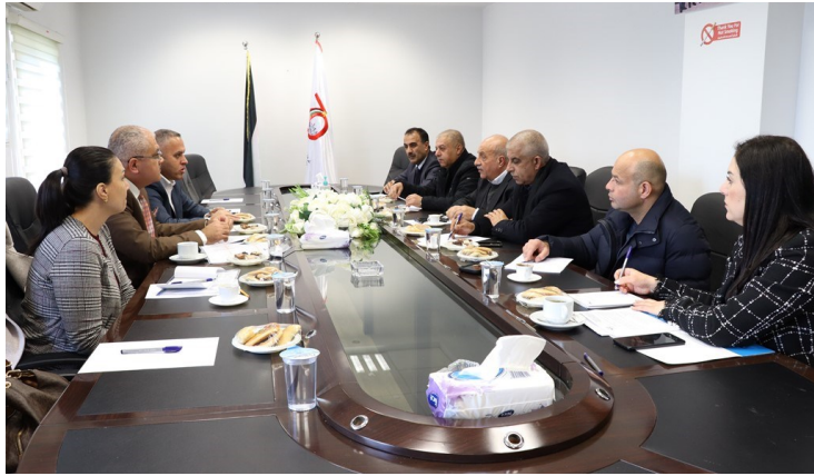
هيئة مُكافحة الفساد