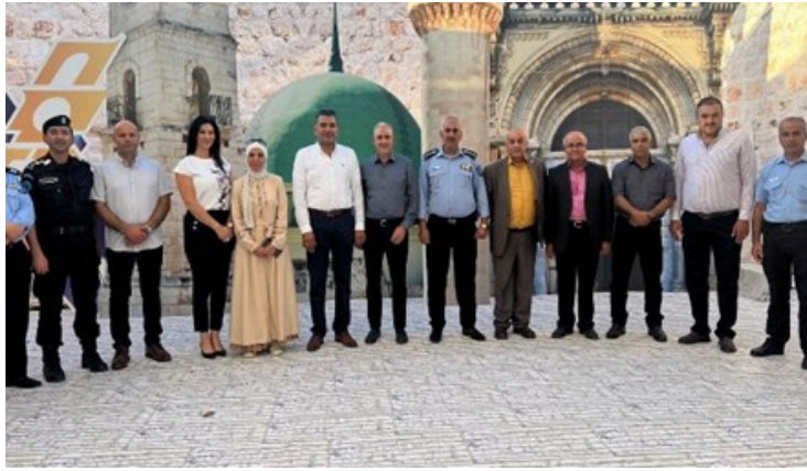
زيارة نابلس اكسبو 2023