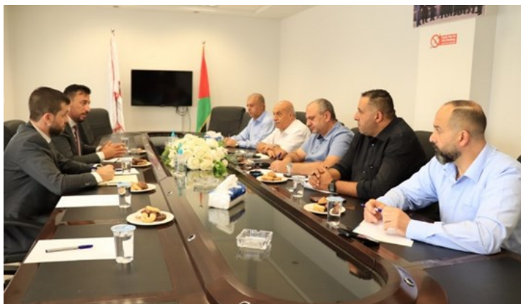
استقبال وفد من بنك الاستقلال الحكومي والتعرّف على الخدمات المُقدمة من خلالهم