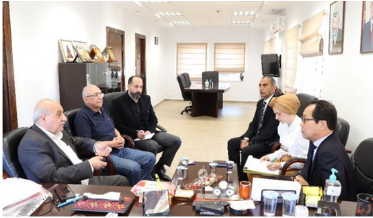
استقبال السفير الياباني لبحث سبل التعاون المشترك