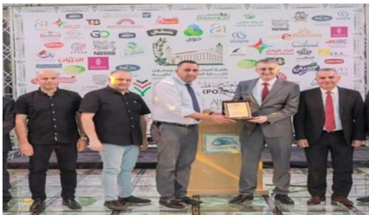
تكريم المشاركين في معرض فلسطين الغذائي