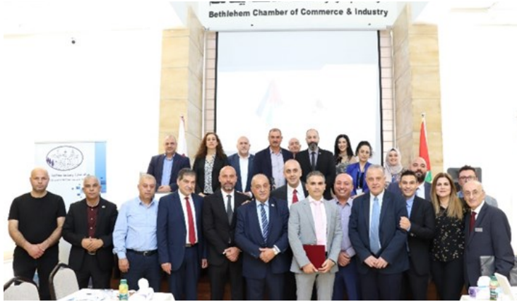
استقبال وفد رفيع المستوى من مدينة بافوس القبرصية