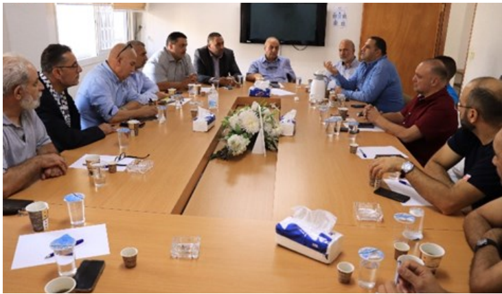
تنظيم لقاء مع مستوردي وتجار المواد الغذائية في المحافظة