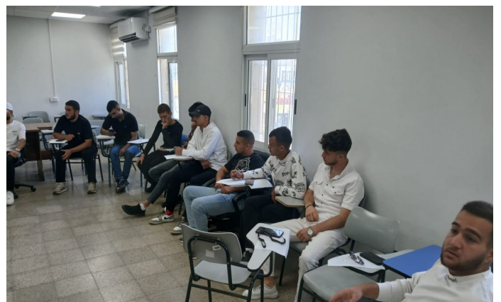
تدريب التصميم الجرافيكي