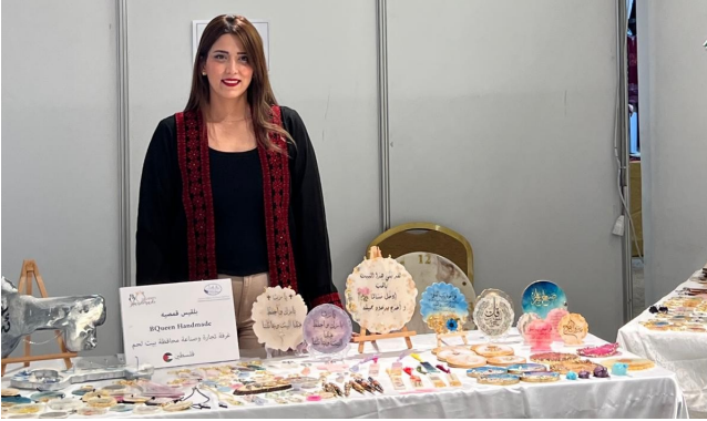
حرف بيت لحم اليدوية حاضرة في معرض الحرف الفلسطيني الأول بالأردن

تضع غرفة تجارة وصناعة محافظة بيت لحم تمكين المرأة في صدارة أولوياتها الاستراتيجية، إيماناً بدورها المحوري كرافعة أساسية للاقتصاد المحلي. وقد تجسد هذا الالتزام من خلال مسارين متوازيين؛ الأول يركز على التمكين الاقتصادي عبر فتح آفاق التسويق الإقليمي لصاحبات الأعمال اليدوية والحرفية، وتعزيز حضورهن في المحافل الدولية لضمان استدامة مشاريعهن الصغيرة. أما المسار الثاني، فيتجلى في المسؤولية المجتمعية من خلال إطلاق مبادرات صحية توعوية شاملة، مثل فعاليات 'أكتوبر الوردي' والأيام الطبية المجانية بالتعاون مع المؤسسات الصحية العريقة. إن هذا النهج الشمولي لا يهدف فقط إلى تطوير المهارات الريادية للمرأة، بل يسعى لتأمين بيئة صحية واجتماعية داعمة، تمكنها من قيادة دفة الابتكار والإسهام بفعالية في التنمية الاقتصادية المستدامة للمحافظة.