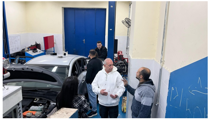
تدريب السيارات الهجينة