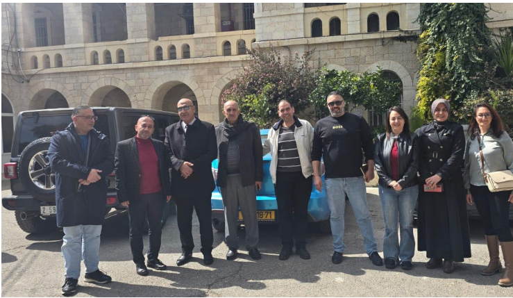
الغرفة تُقدم تجهيزات تقنية لمطبخ مستشفى بيت لحم للطب النفسي

انطلاقاً من واجبها الوطني وتجسيدها لمفهوم التكافل المؤسسي، ضاعفت غرفة تجارة وصناعة محافظة بيت لحم جهودها في مجال المسؤولية المجتمعية، لتشمل تدخلات نوعية دعمت من خلالها البنية التحتية للمؤسسات الصحية والتعليمية في المحافظة. ولم تقتصر هذه الجهود على تقديم التجهيزات التقنية والمستلزمات الضرورية فحسب، بل امتدت لتشمل سلسلة واسعة من المبادرات الإنسانية والإغاثية التي فرضتها الأوقات الصعبة الراهنة. وانعكاساً لهذا الالتزام الاستثنائي، تجاوزت المساهمة المجتمعية للغرفة بكثير نسبة الـ 3% المخصصة من موازنتها، في إشارة واضحة إلى ترتيب الأولويات بما يخدم صمود المؤسسات والمواطنين؛ لتثبت الغرفة أنها ليست مجرد راعٍ للمصالح الاقتصادية بل هي ركيزة أساسية للأمان المجتمعي وشريك فاعل في مواجهة الأزمات.