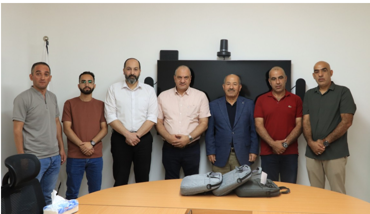
الغرفة تدعم برامج أكاديمية 'ريل' التكنولوجية بأجهزة حاسوب محمولة