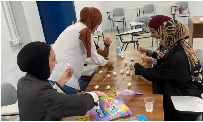
تدريب المهارات الحياتية

نفذت الغرفة سلسلة تدريبات متخصصة بالتعاون مع كاريتاس القدس شملت مجالات حيوية ومتنوعة، بدءاً من المهارات الحياتية والإعلام التفاعلي والتصميم الجرافيكي، وصولاً إلى المهارات التقنية في الكهرباء والسيارات الهجينة وأحدث أدوات الذكاء الاصطناعي، بهدف تعزيز كفاءة الشباب والشابات ومواءمة مهاراتهم مع متطلبات سوق العمل الحديثة