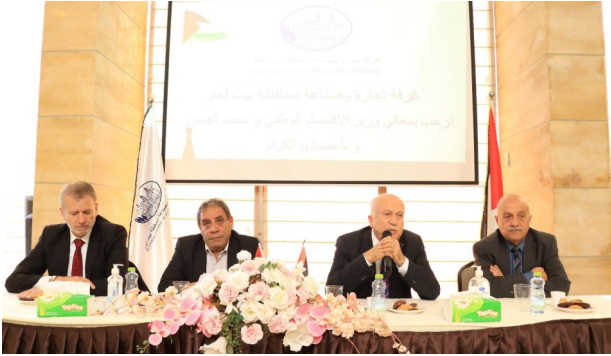
غرفة تجارة وصناعة محافظة بيت لحم تستقبل وزير الاقتصاد الوطني في لقاء موسّع مع أعضاء الهيئة العامة

كرّست غرفة تجارة وصناعة محافظة بيت لحم خلال عام 2025 نهجاً ريادياً في "مأسسة التعاون" مع الهيئات المحلية، حيث نجحت في إبرام مذكرات تفاهم إستراتيجية مع (9) بلديات ومجالس قروية في مختلف أرجاء المحافظة، بهدف توحيد الجهود التنموية وتقريب الخدمات من أعضاء الهيئة العامة في مواقعهم. وتجاوزت رؤية الغرفة حدود التنسيق التقليدي لتصل إلى مرحلة "المناصرة الاقتصادية" من خلال قيادة حوارات مباشرة رفيعة المستوى مع صناع القرار، كان أبرزها اللقاء مع وزير الاقتصاد الوطني لمواجهة التحديات التشريعية والميدانية.