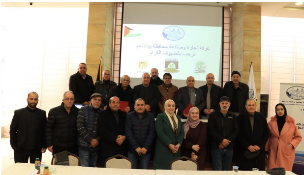
غرفة تجارة وصناعة محافظة بيت لحم توقع مذكرات تعاون مع بلديات بتير و نحالين ومجلس قروي حوسان